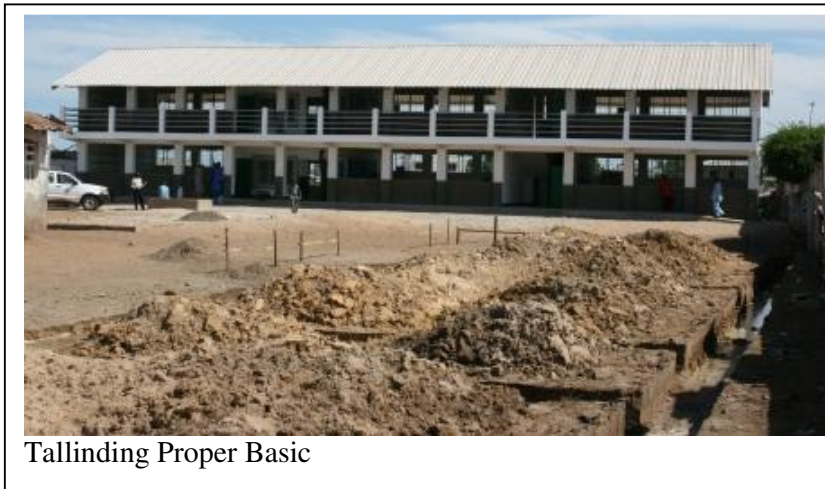
Tallinding Proper Basic

Under veckan har jag varit på besiktning av den första av de tre skolorna i Tallinding! Vi har startat den andra och den tredje blir det byggstart på efter nyår på grund av den höga grundvattennivån! Träffade PCUs representant som varit på "kurs" i London